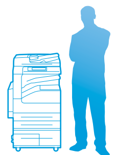
WorkCentre 5335 con vassoio tandem ad alta capacità